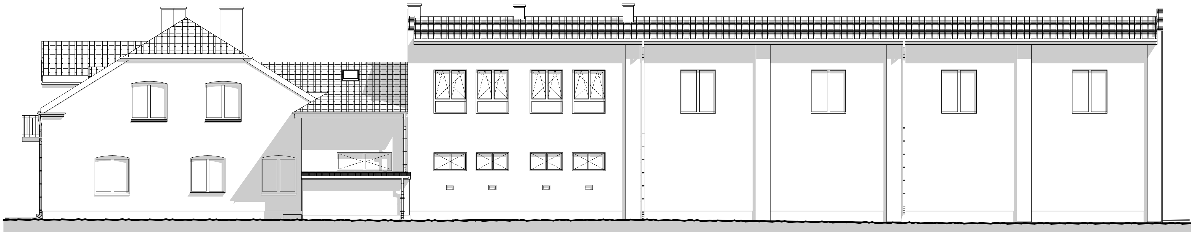
ELEWACJA POŁUDNIOWA - E6